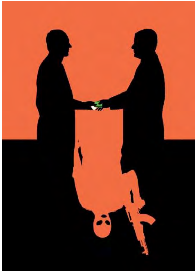
ILUSTRACIÓN DE BEN WISEMAN